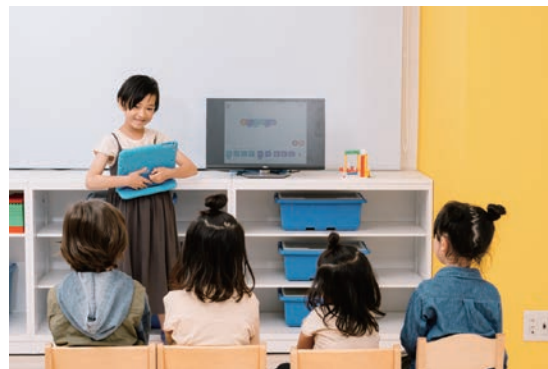
作品やプログラムをつくったら、お友だちに紹介しよう!